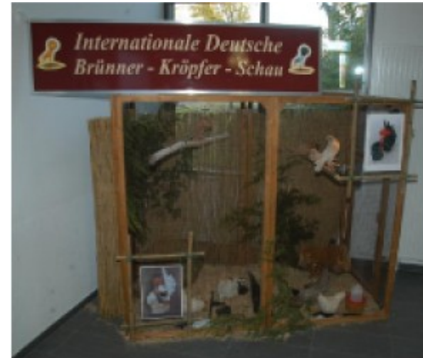
Eine Schauvoliere, besetzt mit Chabo-Zwerghühnern und Brünner Kröpfern.