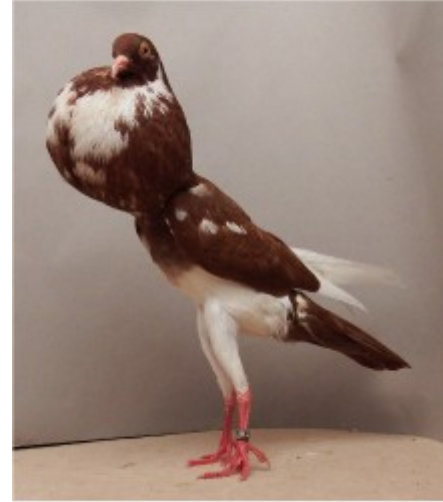
Brünner Kröpfer, rot geherzt