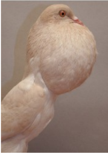
Studie eines Brünner Kröpfers, Isabell m. w. Binden.