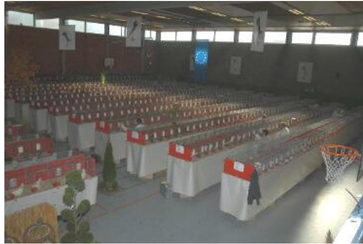
Die schöne Ausstellungshalle.