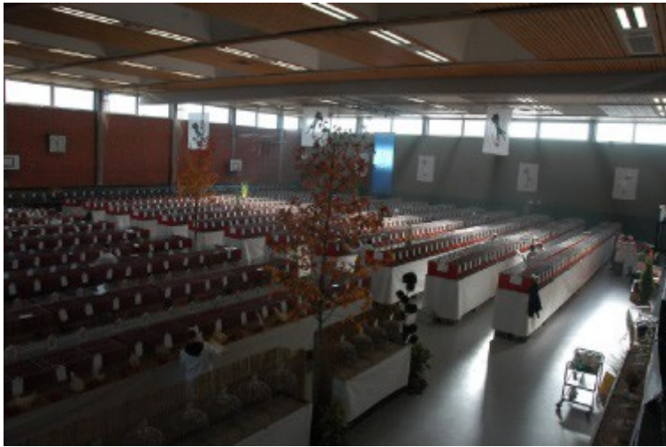
In dieser Halle war alles wirklich angenehm.