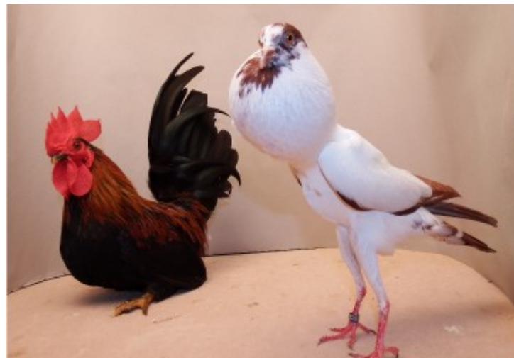
Dieses Foto hat Symbolik: Ein Chabo-Hahn mit einem Brünner Kröpfer.

Von einem beispielgebenden Ereignis berichtet und Frank Böckenfeld in Wort und Bild. Vielen Dank!