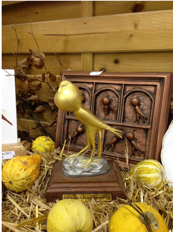
Der „Goldene Brünner“, Fritz Eckstein Gedächtnispreis