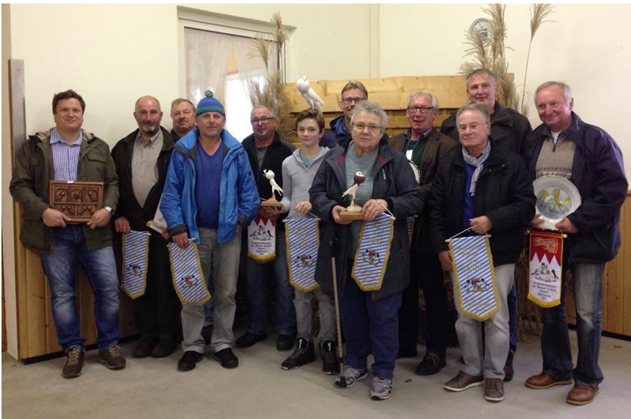
Die erfolgreichen "Sieger"