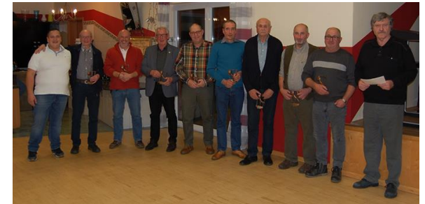
Die Erringer der Großen Deutschen Brünnerpreise