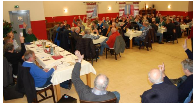
...die Jahreshauptversammlung - Wahlen, Abstimmung

Samstagsmorgens strömten dann alle gezielt in die Ausstellungshalle. Die Tiere wurden begutachtet, ob zufrieden oder nicht, man nahm es hin. Das Gute an der ganzen Sache aber ist, dass man unter Freunden weilt, es gab nicht nur die Züchtergespräche auch per-sönlich kam man sich nahe und so wurde auch manche neue Züchterfreundschaft geschlossen.