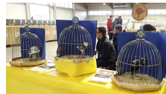
Präsentation auf der VDT-Schau in Kassel

Kleintier-Landesschau Salzburg mit internationaler Brünner-Kröpferschau zum 30-jähriges Jubiläum des österreichischen Brünner-Club