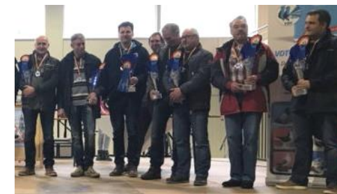
Wir gratulieren unserem Champion der Deutschen Rassetaubenzucht 2018/19