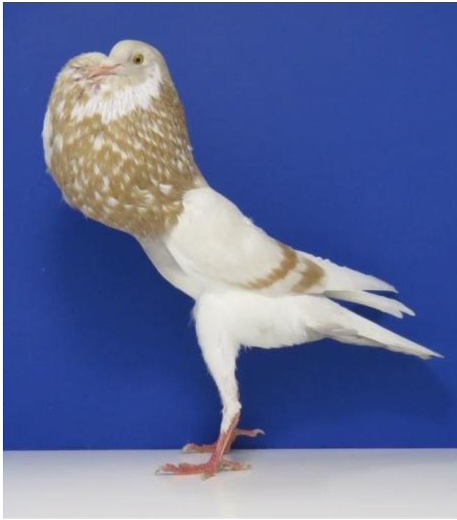
Boulant Français Jaune cendré barré 97 Pts à Yves Thevenoux

- 7 jaune cendré étaient en excellente condition tant au niveau du plumage que du tempérament. Cette couleur tendre est toujours très plaisante. Trois jeunes femelles de très bonne qualité se présentaient très bien, et l'une d'entre elles obtient la note 97 à Yves Thévenoux et le titre de Vice-champion de France. 1 x 97, 1 x 96 et 2 x 95 dans cette classe montrent l'homogénéité de la série.