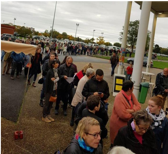
Un public venu en nombre