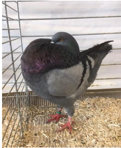
Cage 406 : Boulant d'Amsterdam Bleu barré à Mathieu Metzinger