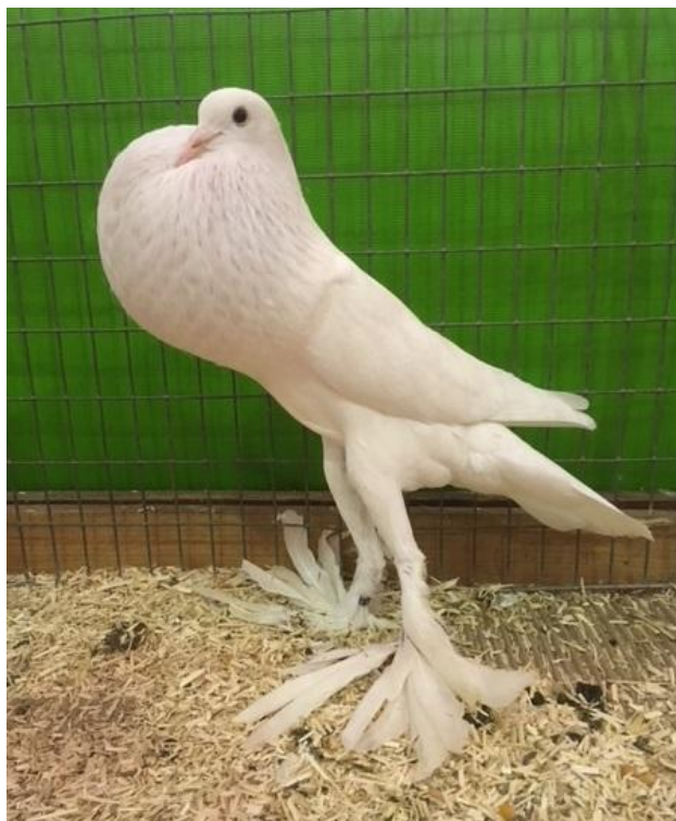
Boulant Anglais blanc 96 Pts à Jean-Marc Lutz