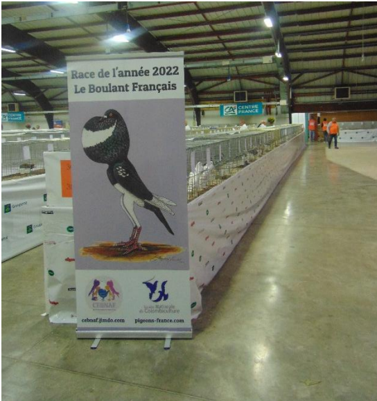
Promotion du boulant Français en cours...