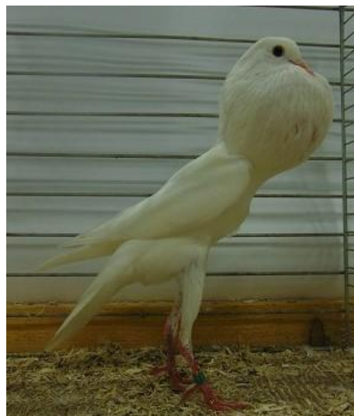
Bouyant Brunner blanc 96 Pts à Yves Thevenoux