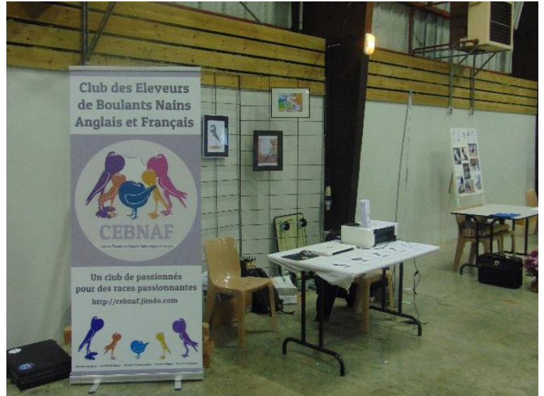
Le stand du CEBNAF avant l'ouverture au public