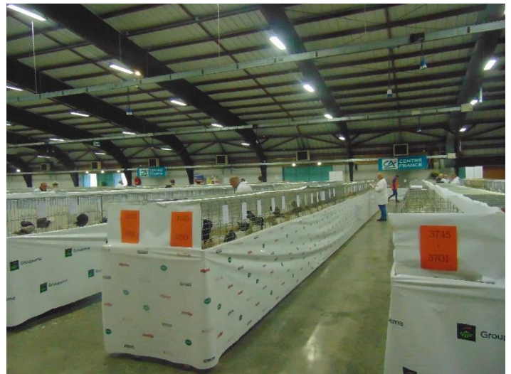
Les boulants en action dans le second hall du parc des exposition de Moulins