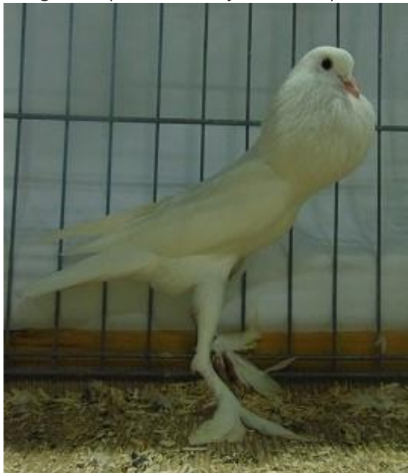
Boulant Pigmy Blanc 97 Pts à Philippe Hudry

Les lignes de profil chez les jeunes sont plus nettes à cet égard, idem vues de face.