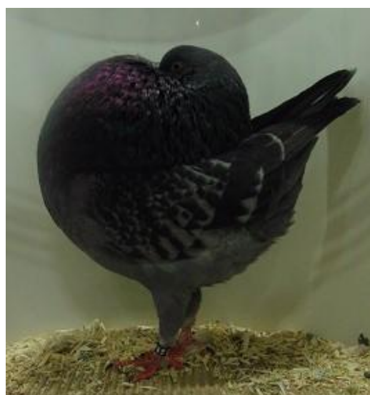
Femelle Boulant d'Amsterdam bleu écaillé 97 Pts à Philippe Hudry

Le juge doit faire l'évaluation au moment où le pigeon est en train de s'approprier ce nouvel environnement. Et tous les pigeons seront beaucoup plus beaux le samedi, et surtout le dimanche quand ils sont habitués à la cage d'exposition. Pour cette raison, l'entraînement que chaque éleveur doit faire à la maison est très important pour mettre en évidence le tempérament et l'action à l'intérieur de la cage d'exposition lorsque le juge essaie d'appeler les pigeons. Samedi, j'ai vu un sujet auquel j'avais attribué 93 pts, mais qui était beaucoup plus en forme et rond ; malheureusement mon travail a dû être fait vendredi alors que le pigeon n'exprimait pas totalement son potentiel.