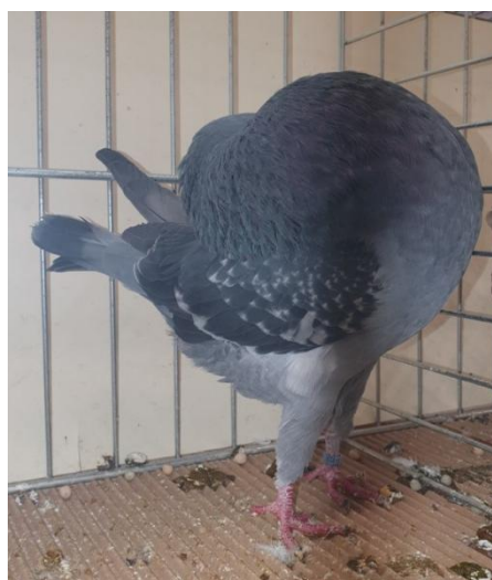
Cage 979 : Boulant d'Amsterdam Bleu écaillé à Jean-Philippe Coutard