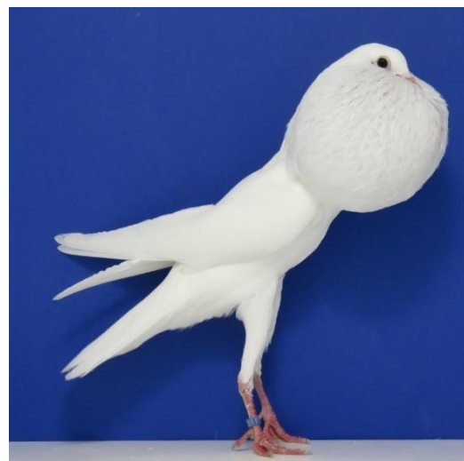
Boulant Brunner blanc 97 Pts à Yves Thevenoux