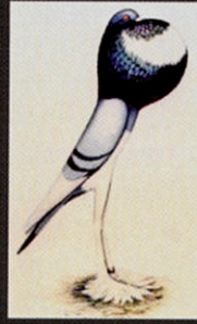
➤ zakrslý anglický voláček