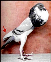
➤ zakrslý anglický voláček

Úzký, dlouhá, na ocasu položena a nekříží se