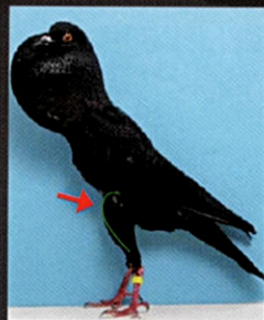
➤ Brněnský voláček