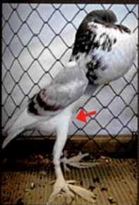
➤ zakrslý anglický voláček