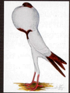
➤ Brněnský voláček