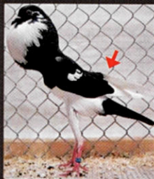
➤ Brněnský voláček

Úzký, dlouhá, na ocasu položena a nekříží se