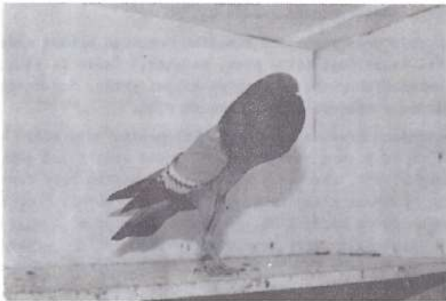
Modrý bělopruhý brněnský voláč ze západoněmeckého chovu.